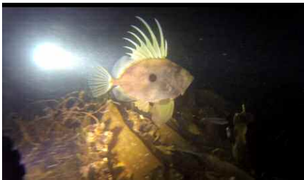
St Pierre (en haut) - Sémaphore de St Cast (en bas)