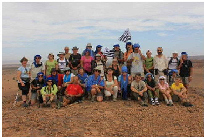
Les 31 marcheurs de l'ASMR

La section badminton organisait, le samedi 30 novembre, la 16 ème édition du tournoi du challenge Hervé Arondel – Tournoi de double mixte.